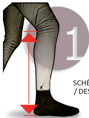
SCHÉMA 1 / DESIGN 1

SHOE SIZING ADVICE / FREEJUMP shoes sizes fit normally. If you are in between sizes, please use the smaller size.