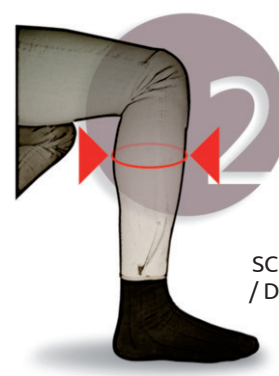
SCHÉMA 2 / DESIGN 2